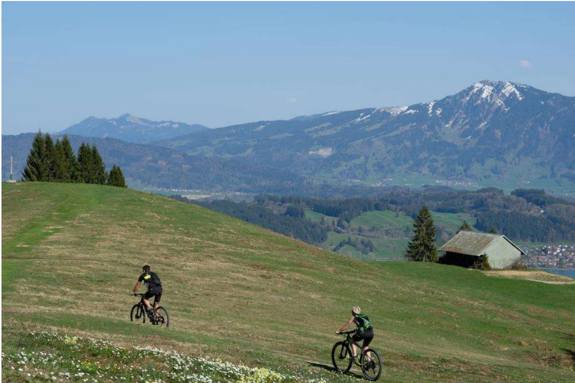
Bild 4: Der Naturgenuss verpflichtet zum pfleglichen Umgang mit der Natur. Nur geeignete Wege dürfen befahren werden.