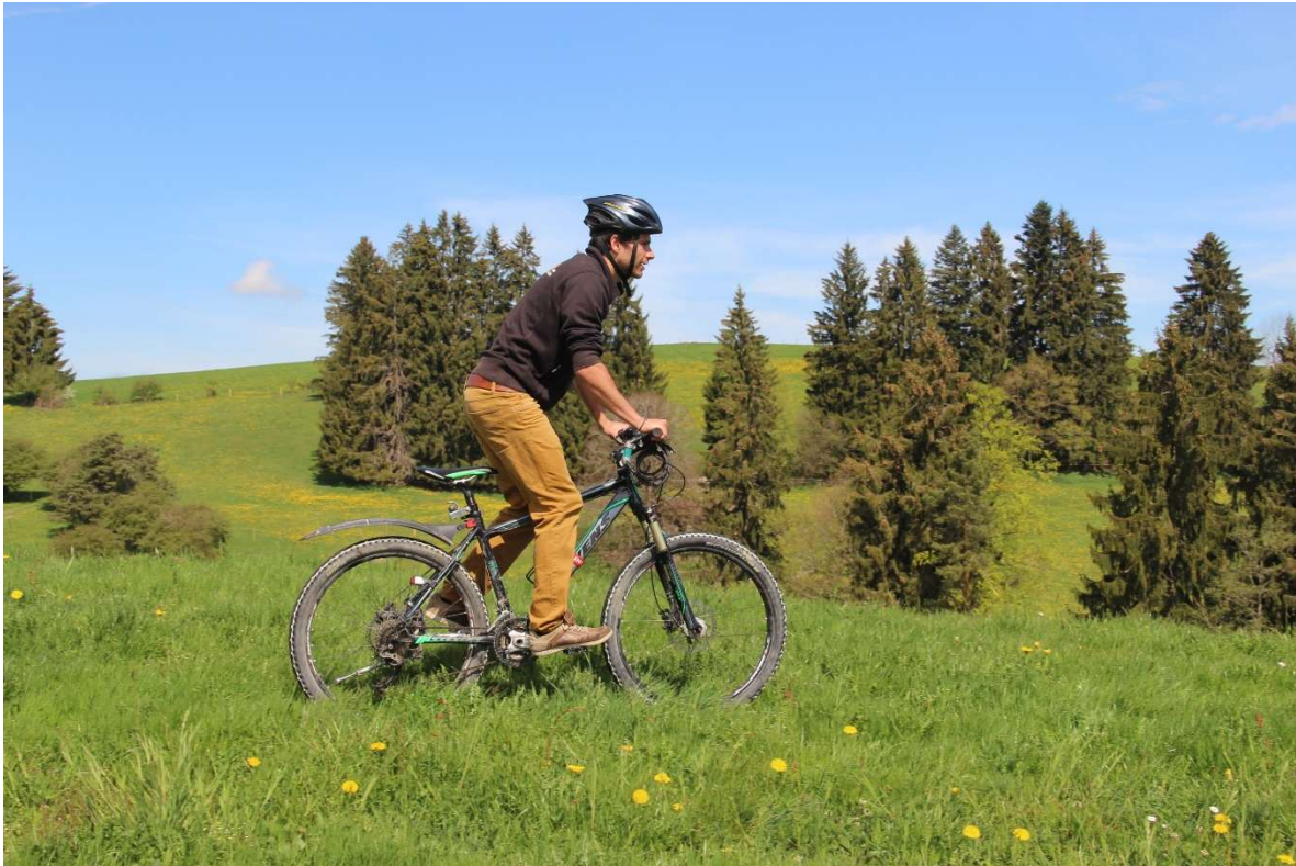
Bild 2: Das Querfeldeinfahren ist auf Wiesen und im Wald verboten