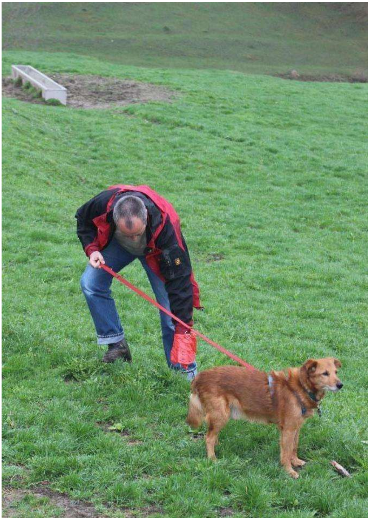
Bild1:Verantwortungsvolle Hundebesitzer leinen ihre Hunde an nehmen beseitigen die Hinterlassenschaften