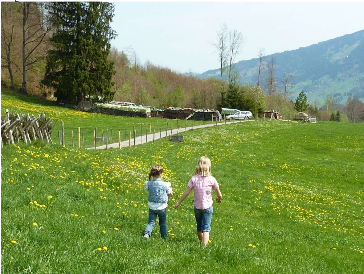
Bild 5: Das Betretungsrecht in Bayern garantiert Naturgenuss und Erholung