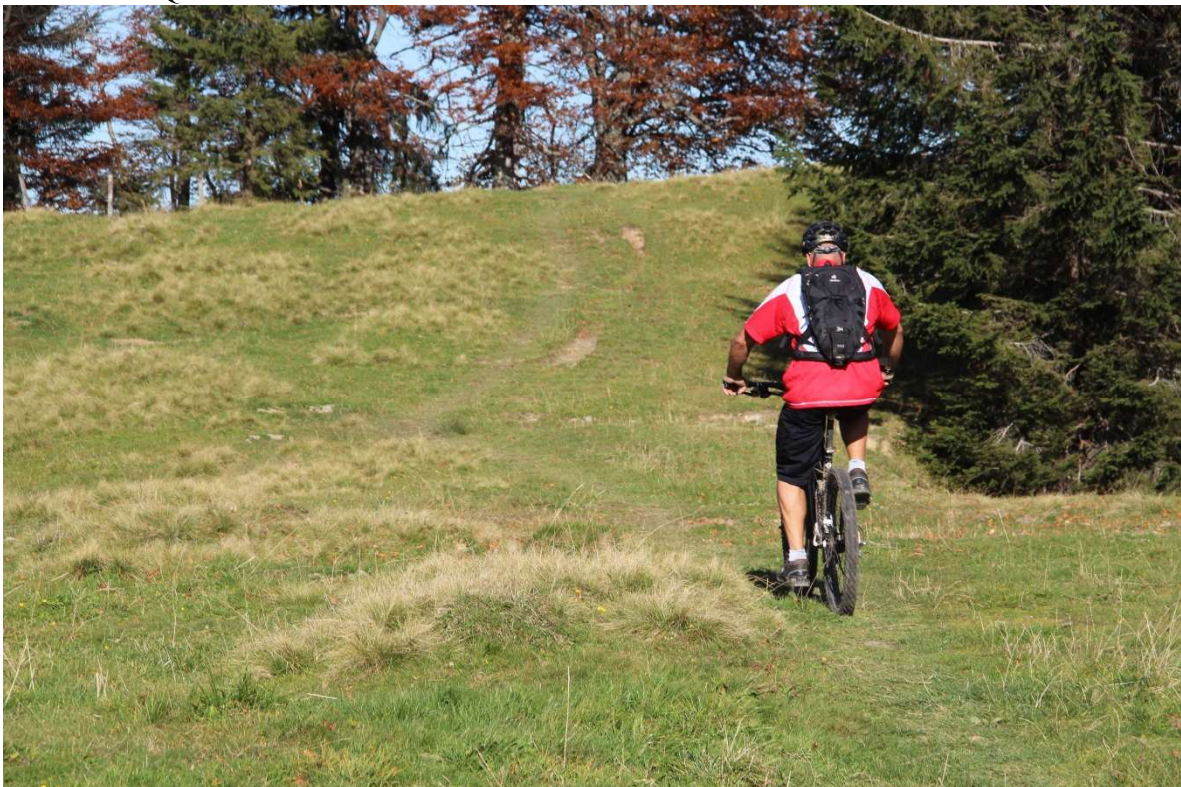
Bild 3: Wilde Wege sind zum Fahrradfahren nicht geeignet, hier wird der Aufwuchs durch das Befahren beschädigt.